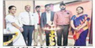
కార్యక్రమాన్ని ప్రారంభిస్తున్న అతిథులు